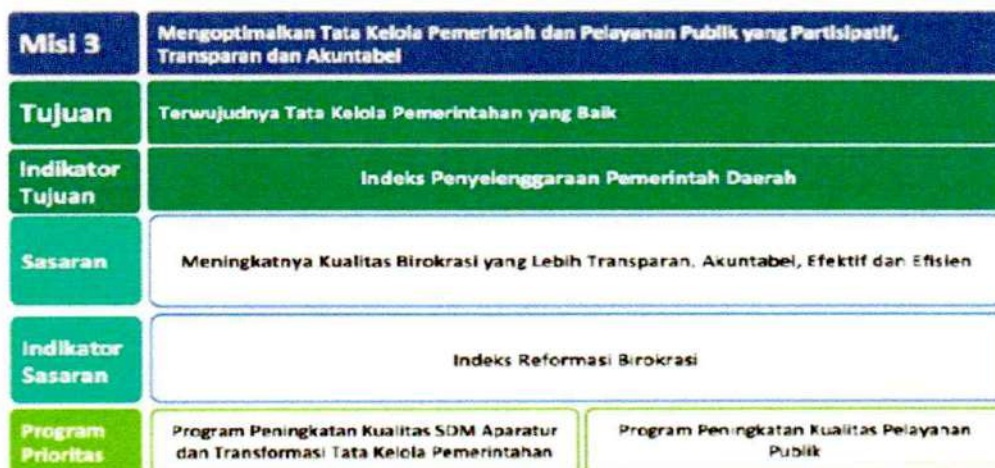
Gambar 2.2 Cascading Misi Pembangunan 3